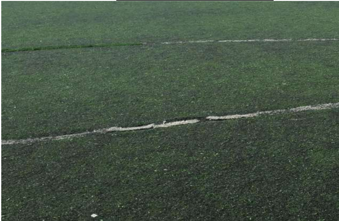
ΕΙΚΟΝΑ 3. ΥΦΙΣΤΑΜΕΝΟΣ ΧΛΟΟΤΑΠΗΤΑΣ "ΧΑΡΑΥΓΗ"

Το ίδιο ισχύει και για τις διαγραμμίσεις.