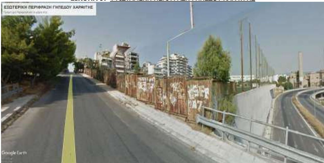
ΕΙΚΟΝΑ 9. ΥΦΙΣΤΑΜΕΝΗ ΠΕΡΙΦΡΑΞΗ ΓΗΠΕΔΟΥ ΧΑΡΑΥΓΗΣ

Οι εξωτερικές περιφράξεις και στα δύο αθλητικά συγκροτήματα είναι της ίδιας μορφής. Η υπάρχουσα περίφραξη αποτελείται από πάνελ μήκους 4,00 m και ύψους περίπου 2,30 m. Τα πάνελ αποτελούνται από πλαίσιο Σιδηροσωλήνα Φ2" και η κλειστή εσωτερική επιφάνεια από λαμαρίνα πάχους 1,5 mm (4 τεμάχια διαστάσεων πλάτους 1,0m και ύψους 2,0m).