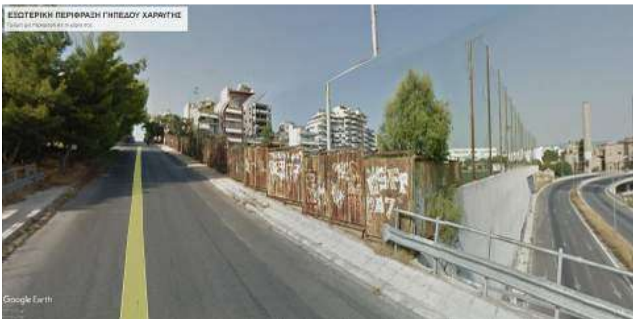
ΕΙΚΟΝΑ 9. ΥΦΙΣΤΑΜΕΝΗ ΠΕΡΙΦΡΑΞΗ ΓΗΠΕΔΟΥ ΧΑΡΑΥΤΗΣ

Οι εξωτερικές περιφράξεις και στα δύο αθλητικά συγκροτήματα είναι της ίδιας μορφής. Η υπάρχουσα περίφραξη αποτελείται από πάνελ μήκους 4,00 m και ύψους περίπου 2,30 m. Τα πάνελ αποτελούνται από πλαίσιο Σιδηροσωλήνα Φ2” και η κλειστή εσωτερική επιφάνεια από λαμαρίνα πάχους 1,5 mm (4 τεμάχια διαστάσεων πλάτους 1,0m και ύψους 2,0m).