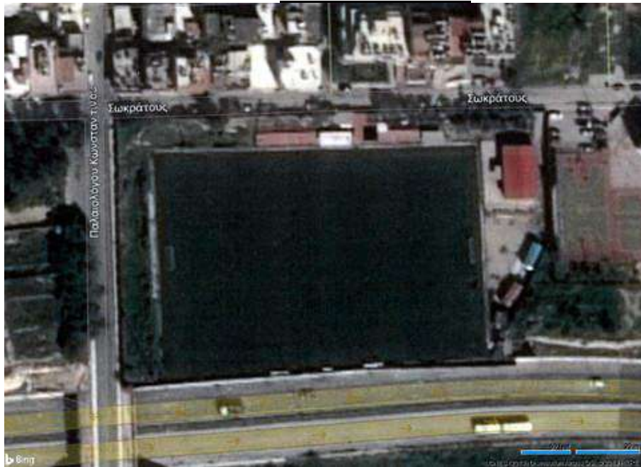
ΕΙΚΟΝΑ 1. ΓΗΠΕΔΟ ΧΑΡΑΥΓΗΣ

Στο Γήπεδο Χαραυγής. Προμήθεια και τοποθέτηση :