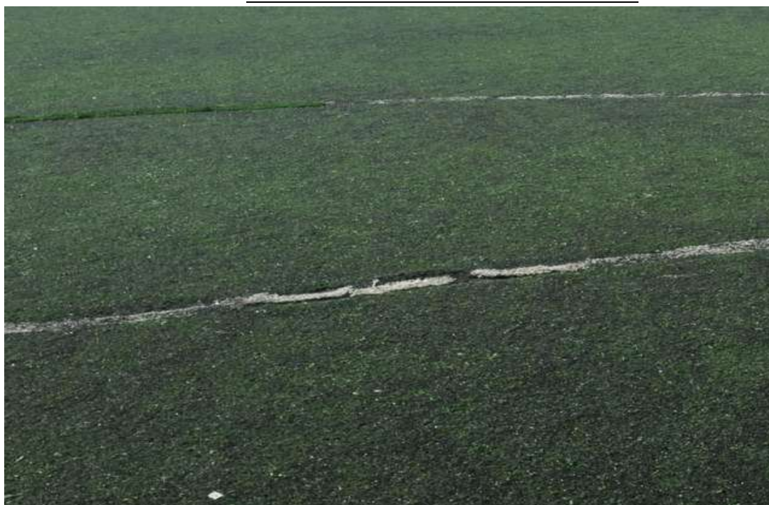
ΕΙΚΟΝΑ 3. ΥΦΙΣΤΑΜΕΝΟΣ ΧΛΟΟΤΑΠΗΤΑΣ “ΧΑΡΑΥΓΗ”

Το ίδιο ισχύει και για τις διαγραμμίσεις.