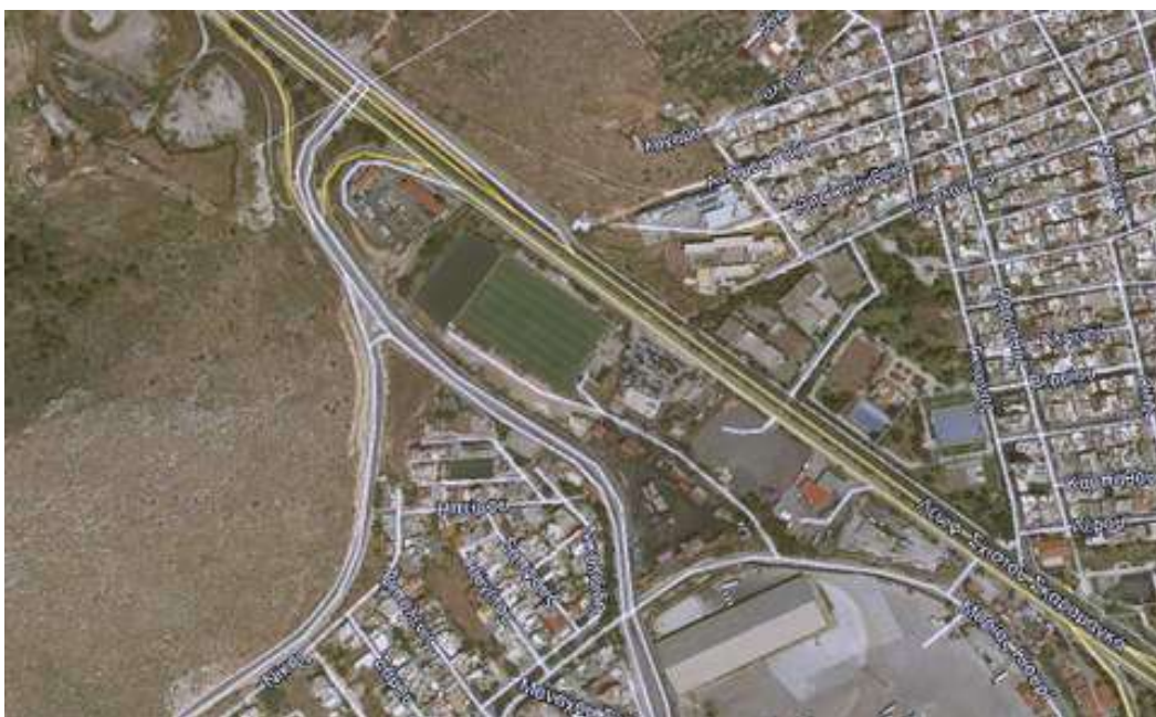
ΕΙΚΟΝΑ 2. Π. ΣΑΛΠΕΑΣ (ΕΥΡΥΤΕΡΗ ΠΕΡΙΟΧΗ)